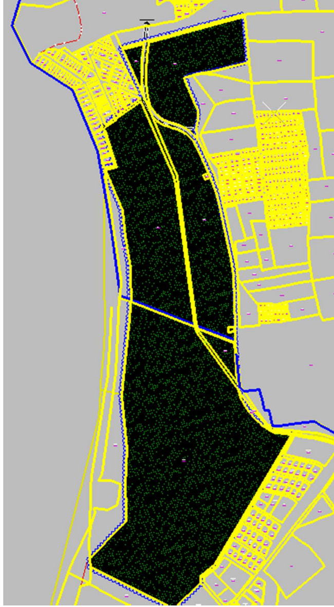
1/1000 Ölçekli Uygulama İmar Planı Durumu