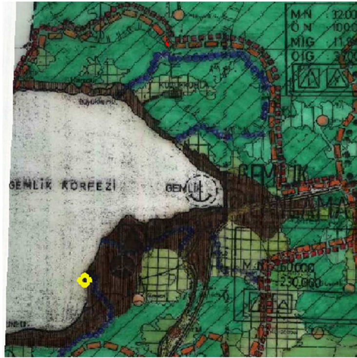
Harita 6 1/100.000 Ölçekli Çevre Düzeni Planı

Sözü edilen bu planda gelişme eğilim ve potansiyellerinden hareketle bazı yeni tanımlamalar getirilmiştir. Bu tanımlamalardan birisi de “Bursa Metropolitan Alanı”dır. Bu alan kapsamında yedi adet alt planlama bölgesi tanımlanmıştır. Bu alanlar Büyükşehir Belediye sınırlarının il sınırı olmadan önceki Bursa Büyükşehir Belediyesi sınırları içinde kalan bölgeleri belirtmektedir. Söz konusu bu bölgeler Merkez Planlama Bölgesi, Batı Planlama Bölgesi, Mudanya Planlama Bölgesi, Kuzey Planlama Bölgesi, Gemlik Planlama Bölgesi, Doğu Planlama Bölgesi, Alaçam (Uludağ) Planlama Bölgesi’dir.