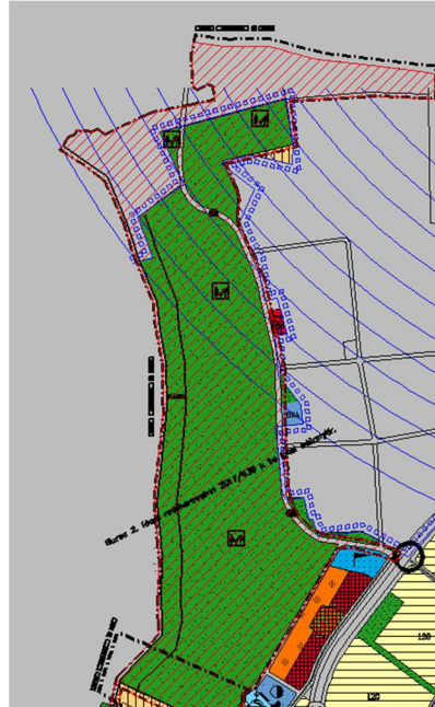
Harita 8- 1/5000 Ölçekli Onaylı Nazım İmar Planı

Plan değişikliği alanı Bursa 2. İdare Mahkemesinin 2016/753 E., 2017/636 K. sayılı ve 30.03.2017 tarihli kararı ile iptal edilmiştir.