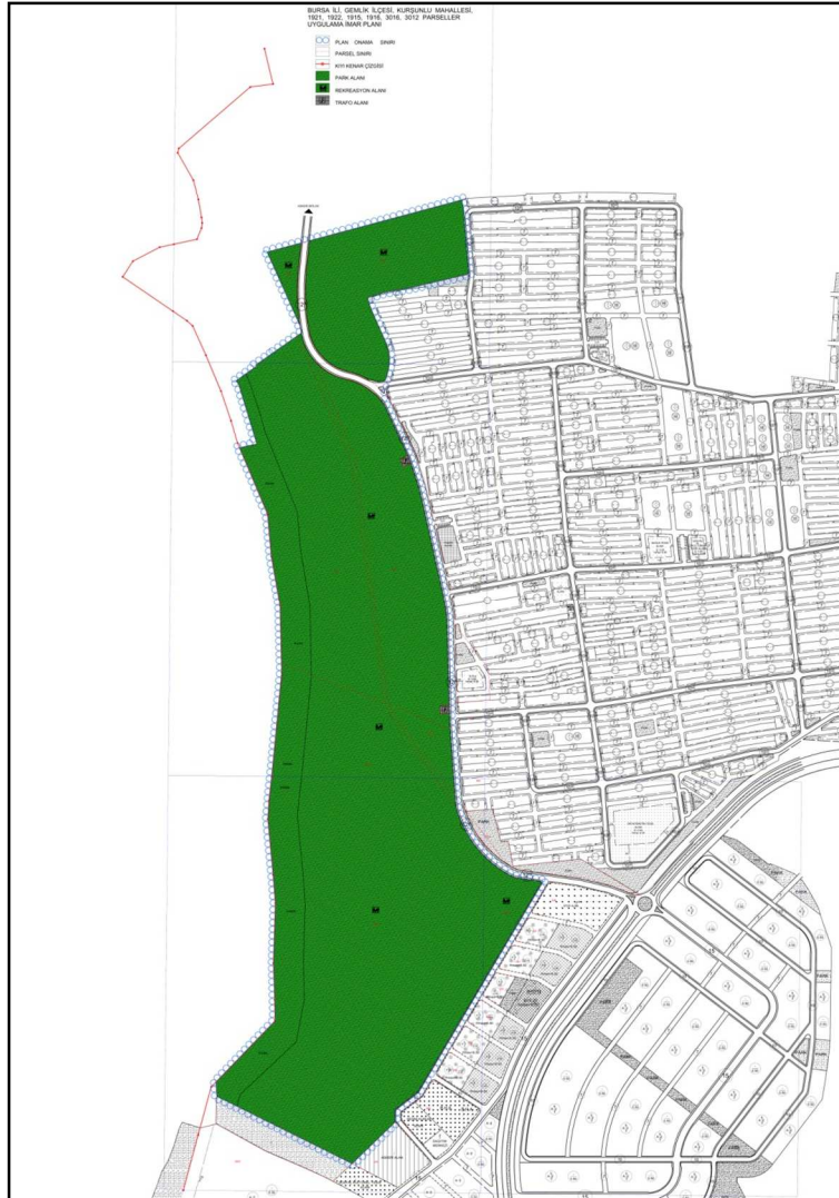
Öneri 1/1.000 Ölçekli Uygulama İmar Planı

Bu kapsamda; 1921, 1922, 1915, 1916, 3016, 3012 nolu parsellerin bulunduğu alanda kıyı kenar çizgisi doğrultusunda onaylı planın deniz tarafı planlama kapsamından çıkartılmıştır. Sahil şeridinin ilk 50 metrelik bölümü park alanı olarak düzenlenmiştir. Sahil bölümünün ikinci 50 metrelik bölümü ve geri sahadaki bölge parkı sahaları ise “Rekreasyon Alanı” olarak revize edilmiştir. Böylece oluşacak büyük kamulaştırma maliyetlerinin önlenmesi ve halihazırda park olarak kullanılan alan içerisinde rekreatif faaliyetlerin de yapılabilmesi sağlanacaktır.