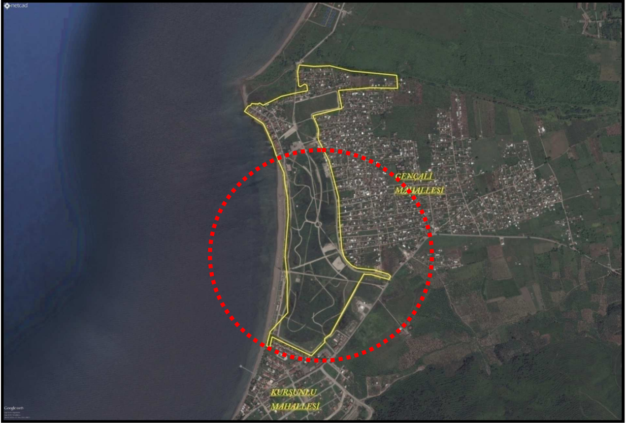
Plan Değişikliği Hazırlanan Alan

PLAN DEĞİŞİKLİĞİ YAPILAN ALANININ KONUMU: Plan değişikliğine konu alan konum olarak Gemlik İlçesinin güneyinde; Kurşunlu Mahallesi kuzeyi ile Gençali Mahallesi Batısı arasında kalan bölgeyi içermektedir. Plan değişikliği hazırlanan alan toplamda 449.885.09 m 2 büyüklüğündedir.